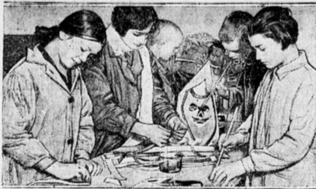
Опытно-показательная школа имени Радищева.