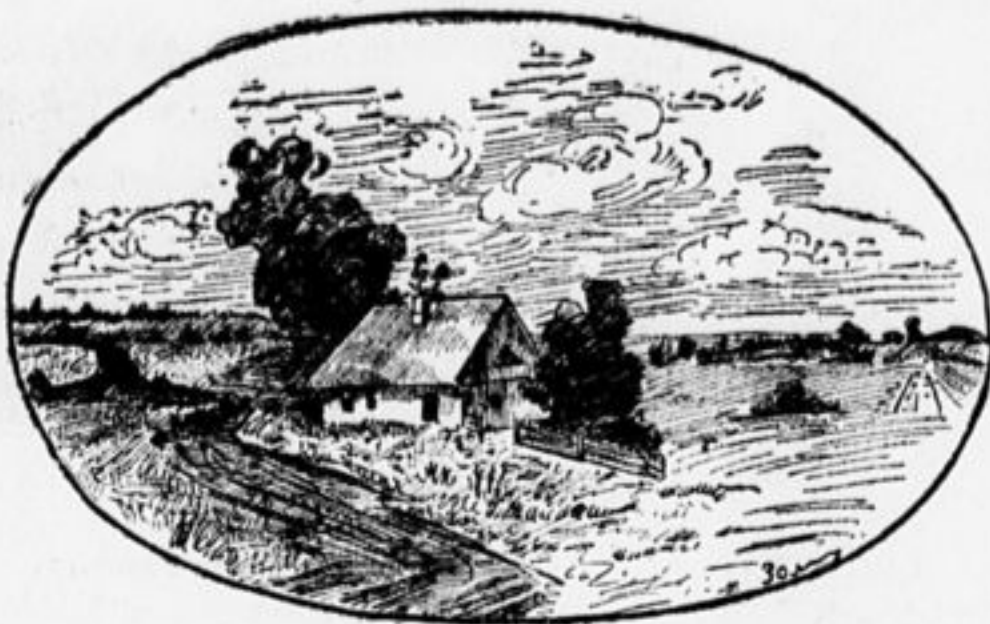
Рис. деткора Хацкеля, 14 лет.