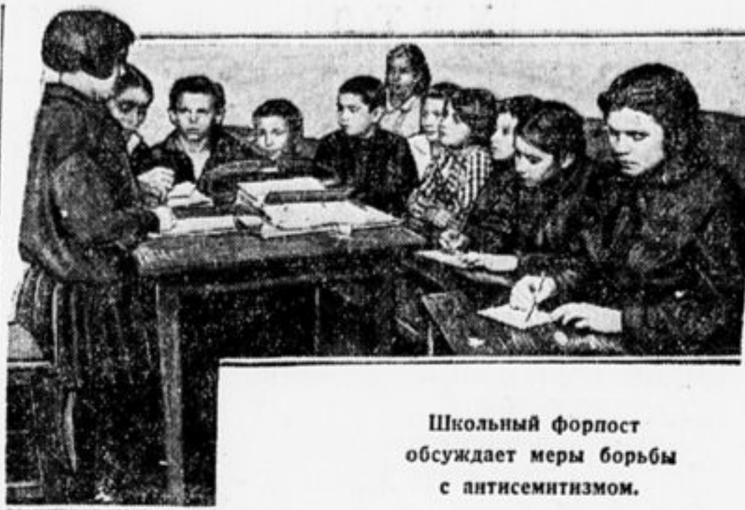
Школьный Форпост обсуждает меры борьбы с антисемитизмом.

Дуб гнилой подпилили пилой. Антисемитизм для школы позор, руби его, пионерский топор!