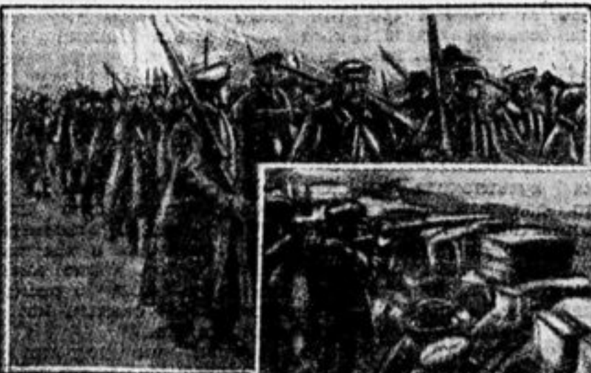
Отряд германской Красной Гвардии.

войну, да здравствует пролетарская революция! 1917 год. Октябрьская революция. Германский фронт сразу дал трещину. Либкнехт уже не один, имя его не сходит с уст — Либкнехт, Либкнехт!