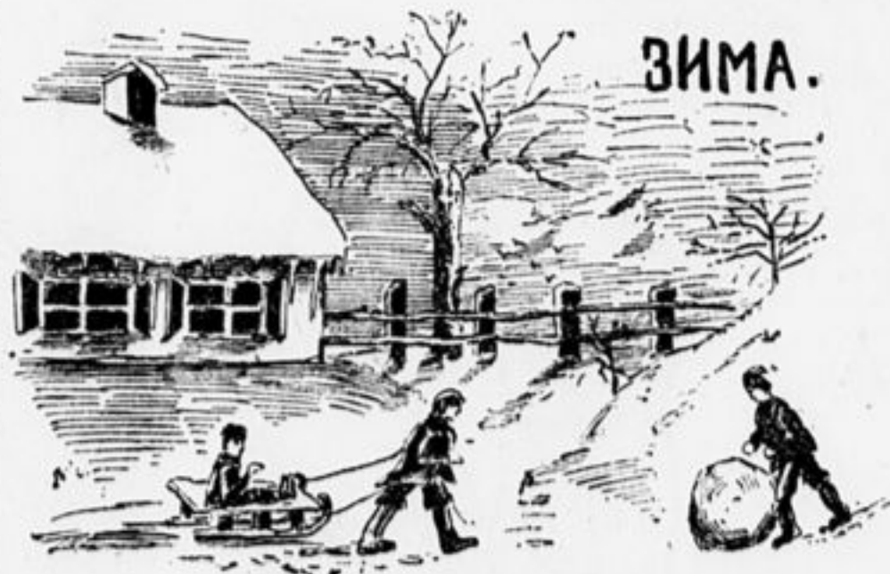
Рис. деткора Хацкеля, 14 лет.