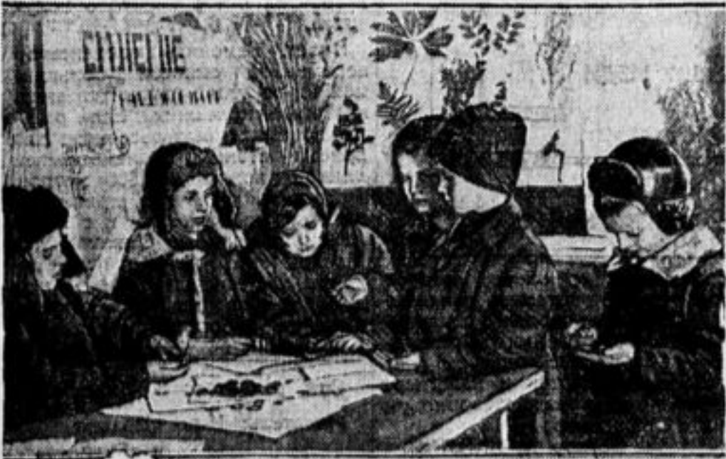
На выставке урожая.